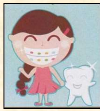
Memiliki Senyum Yang Indah