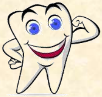
Meningkatkan kesehatan gigi