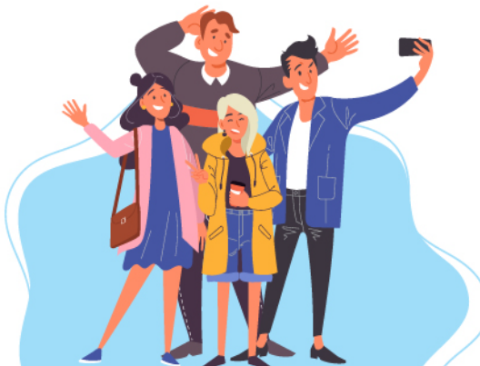
Foto bersama tanpa masker