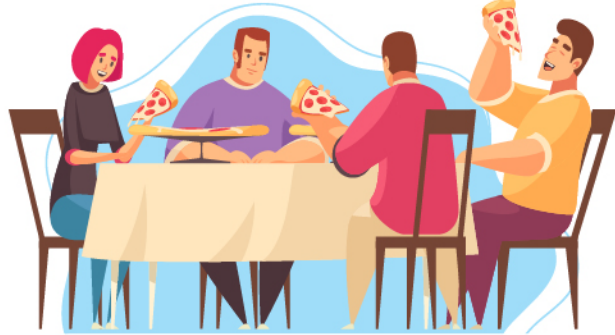
Makan bersama teman (buka masker)