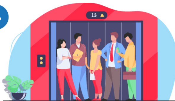
Lift yang penuh