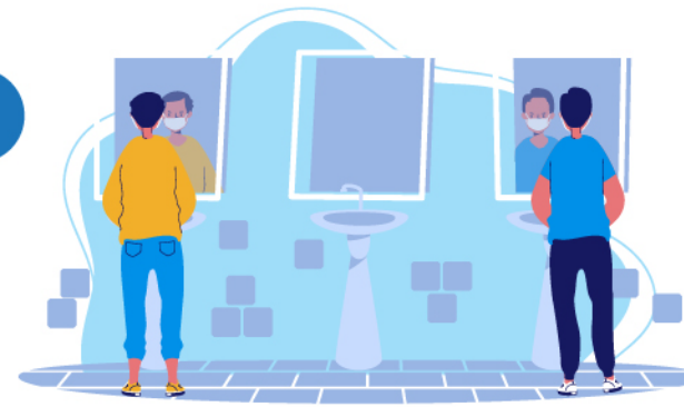
Toilet & tempat wudhu umum