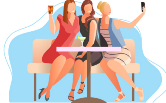
Foto bersama tanpa masker